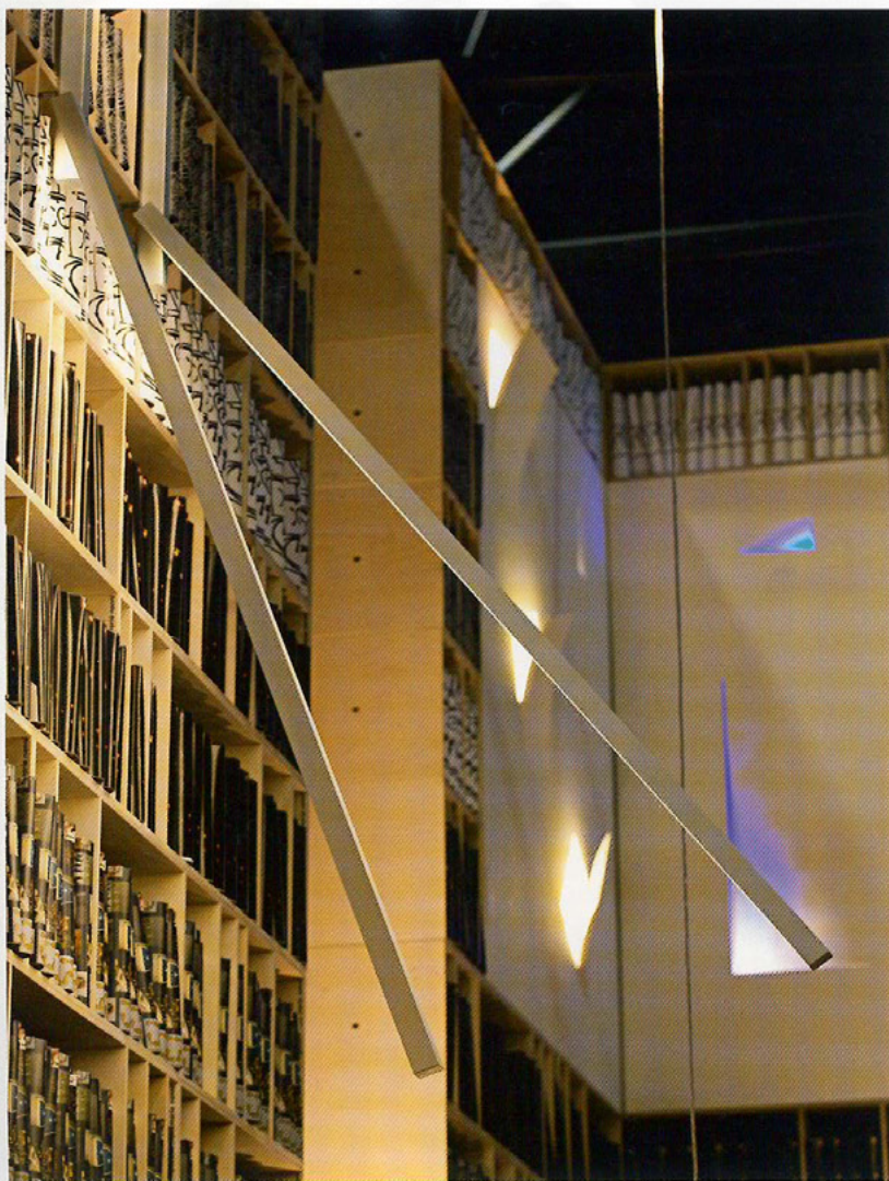
Wandleuchte Spezzata von Mario Nanni | Spezzata wall luminaire by Mario Nanni